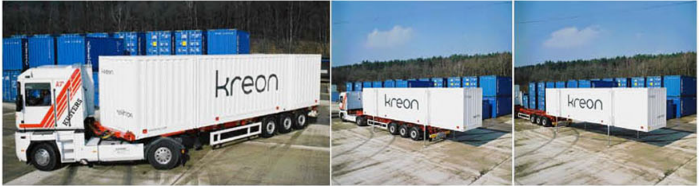
Durant son transport, le stand d'exposition devient une simple boîte compacte et autonome avec son système de vérins