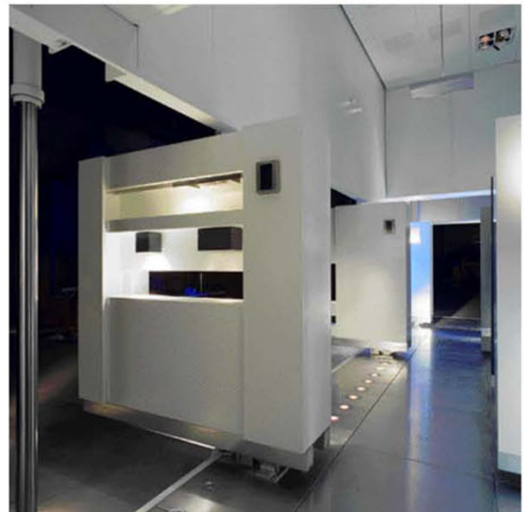
Une fois l'enveloppe dégagée, armoires et installation lumineuse structurent l'espace