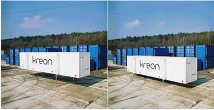
Le conteneur se plie et se dépie tel un jeu de Meccano™

Le commanditaire du stand, la société Kreon spécialisée dans l'éclairage, souhaitait une structure d'exposition la plus mobile possible pour présenter à un large public la philosophie de l'entreprise. L'entreprise tenait à mettre l'accent sur la lumière elle-même et non sur les sources d'éclairage. Les architectes de Eer Architectural Design ont proposé un conteneur d'exposition flexible avec un aménagement entièrement câblé. Le Containing Light est un parallélépipède long de 9,20 m intégrant quatre vérins hydrauliques de 5 m de hauteur, commandés par ordinateur. Ainsi, le conteneur peut se soulever depuis le semi-remorque de transport et se déposer de manière autonome sur le sol, sa position étant fixée par GPS (global positioning system). Utilisant le même système, le boîtier du stand se soulève pour libérer huit armoires de présentation coulissantes ou pivotantes. Le volume ainsi doublé met en évidence l'importance de la lumière dans la définition d'un espace. Les vitrines séparent des espaces qui ont chacun leur ambiance visuelle. Celle-ci varie selon une scénographie lumineuse commandée par un puissant système automatique. Au-delà de leur valorisation par l'éclairage, intérieur et extérieur